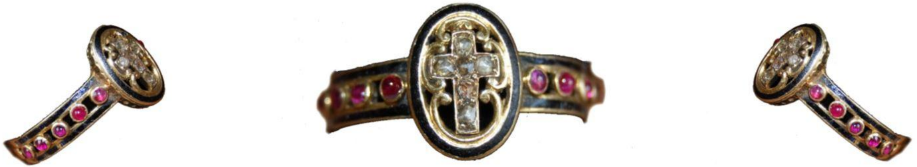
Bague dizain d'Abbesse